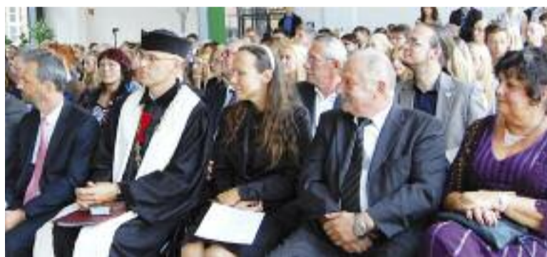
Zcela zaplněná aula školy při přijímání jména Jana Husa