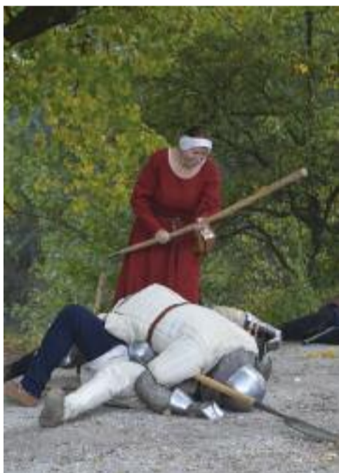
Jak to dopadlo u Sutoměře (k článku na str. 3)

Z programu Divadla MANA Husův sbor Vršovice, Moskevská 34/967, Praha 10 - Vršovice, www.vrsovickedivadlo.cz