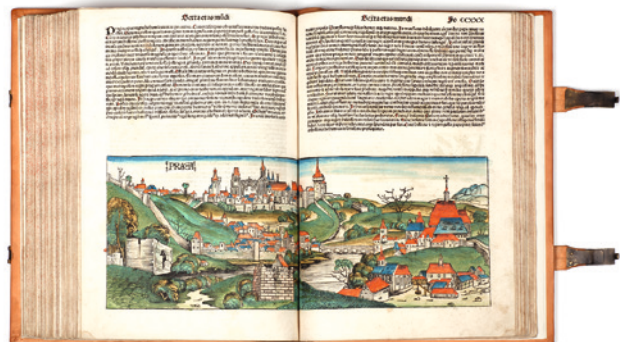
Schedelsche Weltchronik mit Prag-Ansicht Schedelská kronika s pohledem Prahy, Nürnberg Norimberk 1493, Christian-Weise-Bibliothek Zittau

Misály v knihovně Christiana Weiseho patří bezesporu mezi nejcennější poklady Žitavy. Ze šesti svazků z 15. století pocházejí čtyři z Prahy. Tyto sem byly převezeny do bezpečí v roce 1421 vysokými církevními představiteli, kteří v té době prchali před husity na hrad Ojvín a do Žitavy a zůstaly zde až dodnes. Rukopisy vytvořené pro bohoslužebné účely vznikaly v české metropoli za doby života Jana Husa. Jeden ze svazků již nemohl být před útokem dokončen a umožňují nám tak pohled na ilustrátorovu práci. Se svou bohatou obrazovou výzdobou patří tzv. »Žitavské misály« mezi mistrovská díla středoevropské knižní malby.