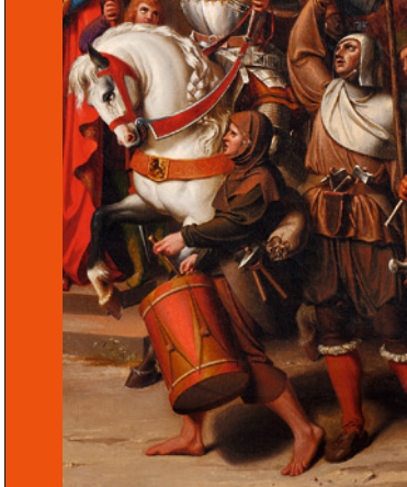
C. G. Rolle, Aufbruch zum Kreuzzug gegen die Hussiten. Zahájení křížové výpravy proti husitům 1843 , Detail, SMZ

Einzigartige Handschriften und Drucke aus dem Unitäts-Archiv Herrnhut und der Zittauer Christian-Weise-Bibliothek bieten zusammen mit Kunstwerken, Bildnissen, Waffen, Münzen und Medaillen, Modellen sowie symbolischen Erinnerungsstücken ein faszinierendes Bild der Hussitenzeit und des Erbes von Jan Hus bis zur Gegenwart. Neben zum Teil noch nie öffentlich gezeigten Werken aus den Zittauer Sammlungen werden kostbare Leihgaben aus Museen, Bibliotheken und Archiven der Region präsentiert. Als Einführung in das Thema dient die Wanderausstellung »Jan Hus im Jahr 1415 und 600 Jahre danach«, die vom Hussiten-Museum Tabor, der Hus-Museumsgesellschaft Prag und dem Hus-Haus Konstanz erarbeitet wurde.