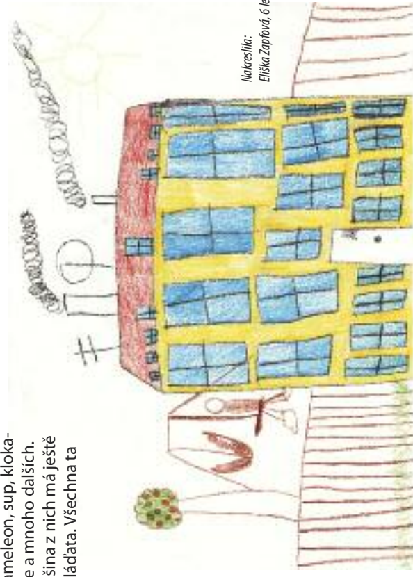
Nakreslila: Eliška Zapřívová, 6 let