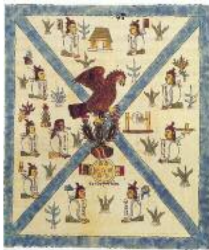
První strana aztéckého kodexu Mendoza z r. 1540 s výjevem z aztécké (mixtécké) mytologie jako symbolem Tenochtitlánu (budoucí státní znak Mexika).

U ruin i jinde je mnoho muzeí, kde se prezentují archeologické vykopávky. Indiáni jsou obecně dost šikovní na práci s hlínou, takže můžeme vidět spoustu nádherných figurek a nádob, kamenných soch a stél s nápisy. Mayské rukopisy byly skoro všechny zničeny konkvistadory, ale na sté-