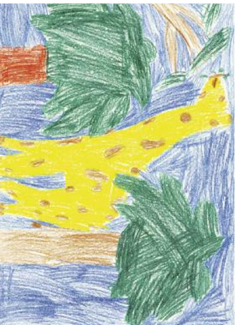
Nakreslil: Fenda Krutiřík