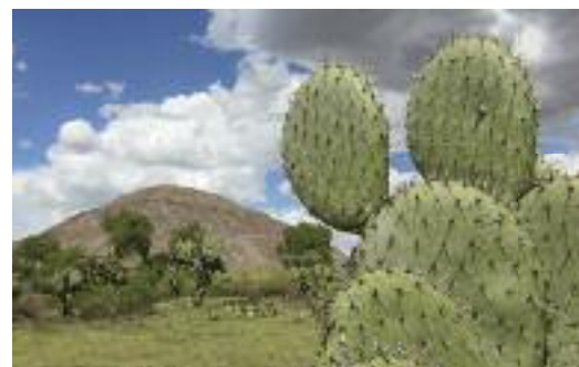
Pyramida v Teotihuacanu

Aztécká civilizace byla v některých ohledech vyspělejší než evropská, avšak temnou stránkou jejich kultury byly nepochybně lidské oběti. Obětovaným lidem – především zajatcům – vyřezávali srdce a pak je shazovali z pyramid. Nejvíce tím proslulo kultovní centrum Teotihuacán nedaleko hlavního města, kde stojí mj. i pyramida Slunce, jedna z největších staveb světa a cíl všech turistů. Je známo, že misionáři někdy staví kostely na místech předkřesťanských svatyní, ale v Mexiku jsem se s tím setkal poměrně zřídka; např. ve městě Cholula je krásná