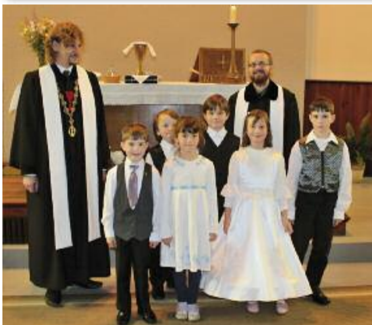
Z prvního přijímání v Červeném Kostelci