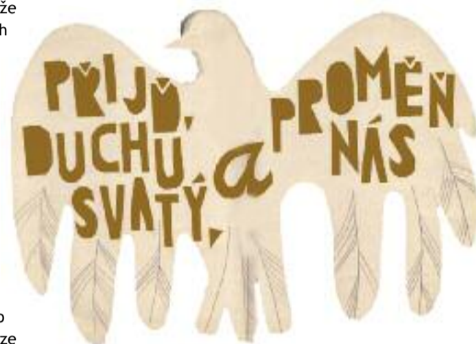
Autorka: Jana Wienerová

Při jáhenském nebo kněžském svěcení klade biskup se spolusvětiteli ruce na hlavu svěcence a je při tom vyslovována formule: „Posiluj a posvěcuj tě, bratře (sestro), Bůh Duchem svým svatým.“ Jen v síle a v posvěcení Ducha svatého je možné konat vytrvale a věrně jáhenskou a kněžskou službu Bohu a lidem.