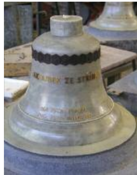
Na snímku voskový model jednoho ze zvonů