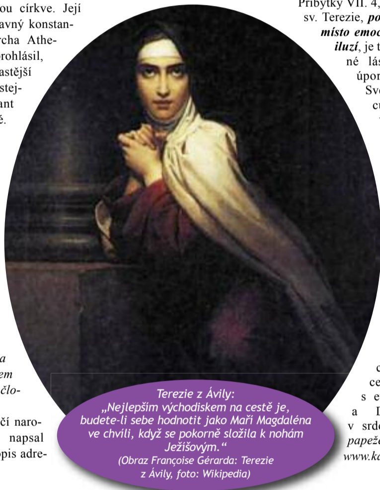
Terezie z Ávily:

Kéž všechny nakazí svým svatým spěchem, abychom kráčeli po cestách naší doby s evangelium v ruce a Duchem svatým v srdci!“ (Zdroj citátů papeže Františka: www.karmelity.cz ) LA