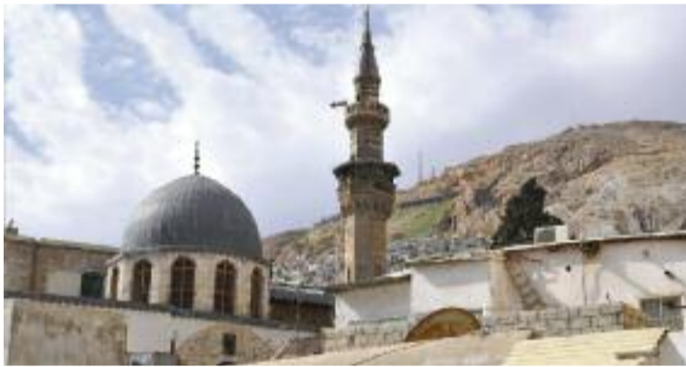
Hrobka největšího mystika islámu Muhjiddina ibn Arabiho v Damašku