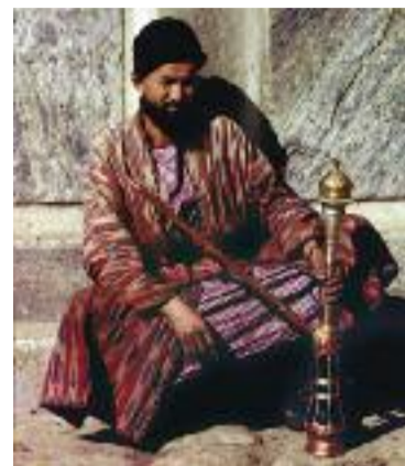
Samarkand 1905-15

K masakrům ve jménu islámu nelze mlčet. Z povahy své víry i občanského smýšlení odsuzují nábožensky motivované násilí a modlím se za oběti a pozůstalé. Ale není mi zcela pochopitelné, proč satira na účet zakladatele náboženství je pro některé lidi symbolem svobody. Je to spíše vyzyvavá podpora ateismu, a hlavně zbytečná provokace, i když přiznávám, že v náboženství je humor důležitý. Nejistoty ovšem nahrávají pojetí jediného Boha jako krutého soudce. Násilí se pak nelze divit. Víra a její interpretace jsou dvě věci. Víra v Boha a násilí v jeho jménu jsou také dvě věci. Otázka, zda je Alláh opravdu Bohem milosrdným a slitovným (Súra 1,1), musí zodpovědět především sami muslimové. Tomu žádné karikatury nepomohou, spíše uškodí. Křesťané, židé ani lidé nevěřící by muslimy neměli apriorně stigmatizovat terorismem a házet do jednoho pytle s islamistickými milicemi všeho druhu, protože tím vyvolávají atmosféru strachu a nedůvěry, která násilí nahrává. Kdo zná osobně nějakého muslima, ví také, že to prostě není pravda. Naopak muslimové by měli přijmout fakt, že žít v cizím státě znamená dodržovat jeho zákony, a to i tehdy, pokud nejsou s islámem v souladu. Není to ale tak jednoduché. Mluvčí Muslimské unie v ČR ospra-