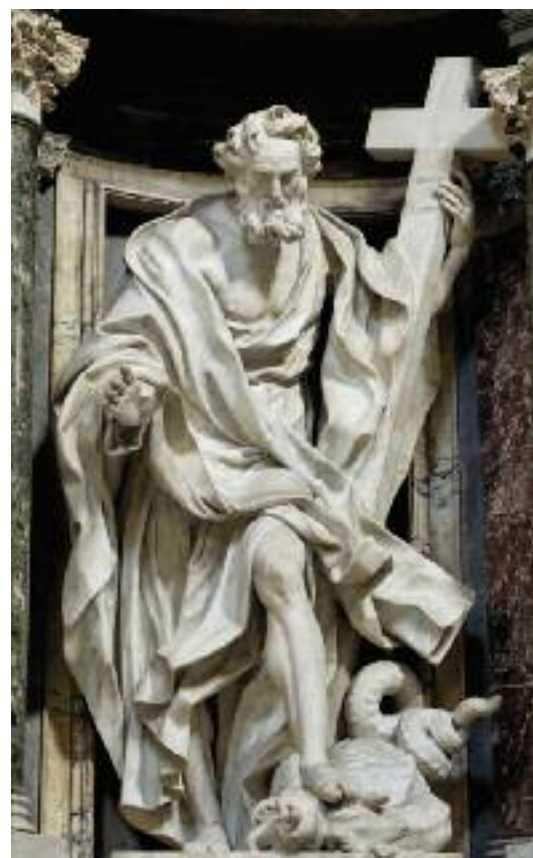
Socha apoštola Filipa v bazilice sv. Jana v Římě v Lateráně

Natanael byl prostě opatrný, a to ho ctí. Nechtěl se lehkověrně dát oklamat falešnou nadějí. On tu Pravdu, která zatím, jak se zdá, vítězí jen na prapuru nad naším Hradem, poctivě hledal. Trvalo mu to delší čas a to hledání skončilo teprve v okamžiku setkání s Ježíšem. Teprve tady našel konečně to, co hledal – svůj pevný záchytný bod. Ježíš ocenil Natanaela hned, jak jej viděl přicházet: „Hle, pravý Izraelita, v němž není lsti!“ I my míváme tendence při prvním setkání hodnotit cizího člověka podle toho, jak vypadá, jaký dělá dojem, jak se nám líbí, je-li sympaták nebo není a pak ho hned milostivě uznat, nebo zavrhout. Ježíš, Boží Syn, však do člověka vidí. Ví, co je v něm, od samého počátku. Vždyť Bůh zná své stvoření. Proto si může dovolit okamžité hodnocení a chválí Natanaela, že v něm potkává pravého Izraelitu, sice opatrného, ne však vychytralého, člověka rozvázně, úporně, ale o to poctivěji hleda-