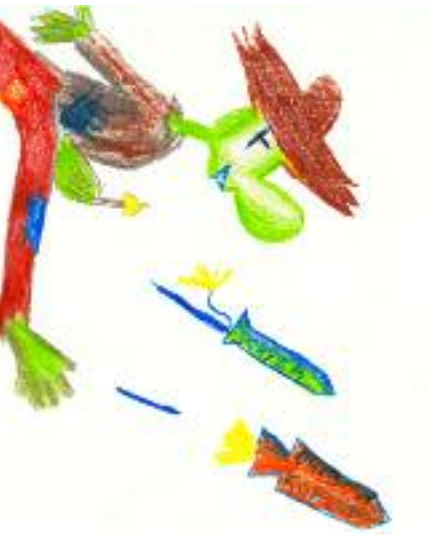
Nakreslila: Lucie Krájčíková

dobná snídani. Nějaké cukroví bylo u nás zřídkakdy.