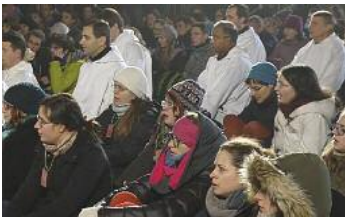
Mladí lidé na jednom ze setkání v rámci letošní „Pouti důvěry“ Taizé v Praze - na ekumenické novoroční bohoslužbě v katedrále sv. Víta

pořádá ČCŠH ve spolupráci s ERC v ČR již tradiční ekumenickou studentskou slavnost, po jejímž skončení se budou moci studenti různých teologických fakult a škol a nejrůznějšího vyznání zapojit do diskuse o M. J. Husovi. Bude zajímavé, vyvstanou-li obdobné otázky, jako od mladých věřících v rámci Taizé workshopu o Husovi, kde se ptali kupř. na to, zda-li je ještě něco v učení J. Husa, co je