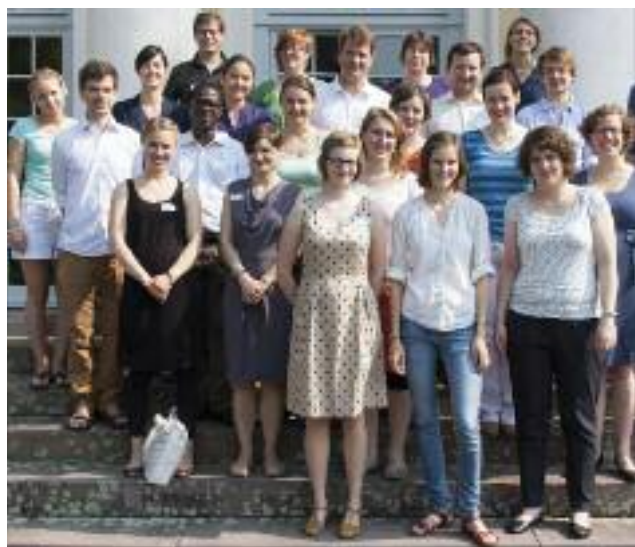
Společné foto mládeže v německém Hofgeismaru v r. 2013.

mostatněním od ekumenické organizace Konference evropských církví (Conference of European Churches). Hlavním motivem osamostatnění byl nedostatečný zájem o práci s mládeží v evropské ekumeně. Cílem tedy bylo vytvořit platformu mladých křesťanů, která jim umožní setkávat se, vzájemně se obohacovat odlišnostmi a současně sdílet víru v jediného Boha.