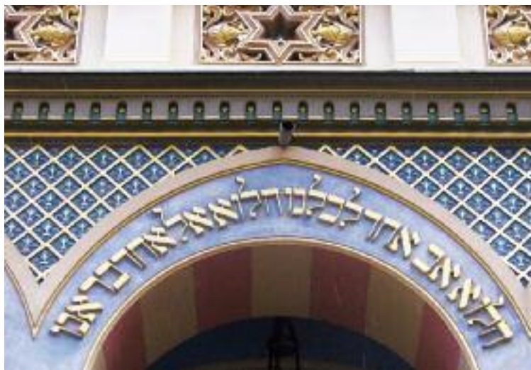
Nápis na Jubilejní synagoze v pražské Jeruzalémské ulici: „Což nemáme my všichni jednoho Otce? Což nás nestvořil jediný Bůh?“ (Malachiáš 2,10)

slova Božího! Tuším, že opravdovost ekumenického soužití církví je také v dlouhodobém plánu papeže Františka. Ale vytkl si zajisté priority a vytáhl nejdříve do boje s chudobou – a na jejím druhém pólu s nádherou, pompou a bohatstvím ve vysokých hierarchických vrstvách kléru.