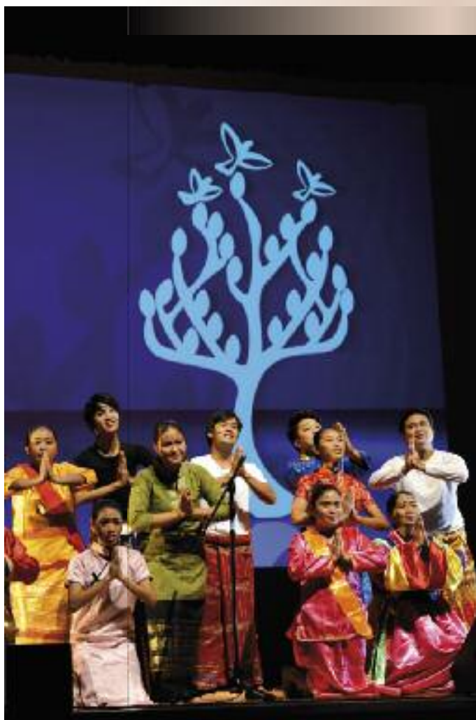
Z tanečního představení v rámci 10. valného shromáždění Světové rady církví v Pusanu (Korejská republika) v listopadu 2013.

Světová rada církví (World Council of Churches - WCC) je mezinárodně působící organizací (se sídlem ve Švýcarsku - v Ženevě), která sdružuje většinu křesťanských církví z celého světa. Světová rada církví (dále SRC) vznikla v návaznosti na úspěchy ekumenického hnutí; oficiálně byla založena v roce 1948 na prvním shromáždění v Amsterdamu, kterému předcházelo 1. setkání komise Život a dílo (Life and Work) ve Stockholmu v roce 1925, jehož se zúčastnila řada církví z celého světa i z Evropy. Toto setkání vyvolalo obecné nadšení církví a vizi ve smyslu možné spolupráce mezi církvemi a vedlo i k očekávaným nadějím při konferenci Víra a řád (Faith and Order), která se poprvé sešla v Lausanne o dva roky později v roce 1927. Následným spojením obou konferencí vznikla (oddáleno 2. světovou válkou) SRC. SRC byla jedinou organizací, která v minulosti v nelehkých situacích umožňovala sdílení se východních zemí se západními partnery.