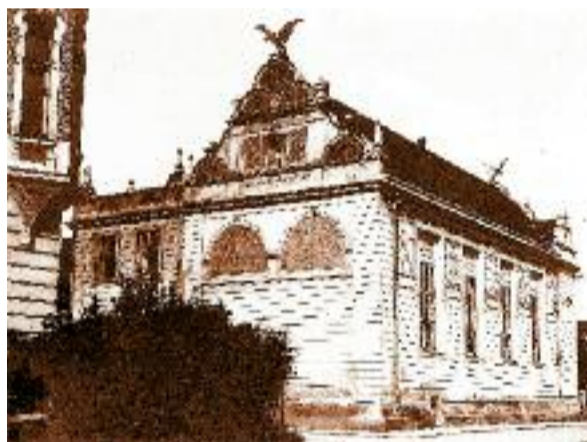
Sokolovna v Litovli před přestavbou, nyní sbor ČČSH