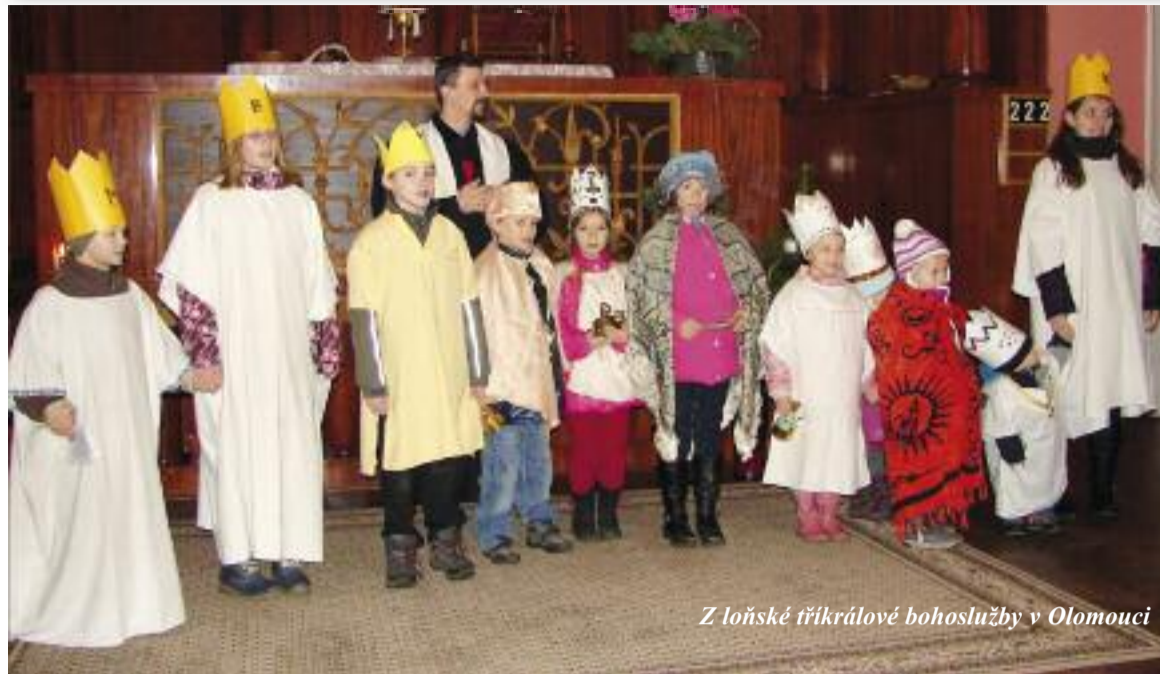
Z loňské tříkrálové bohoslužby v Olomouci