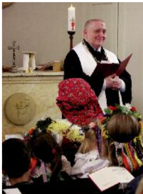
Br. biskup káže vloni na svatováclavské pouti v Olomouci-Černovíře

Rozhodně vítám, že také v životě církve skončilo období, kdy (mizerné) mzdy duchovních byly přidělovány ministerstvem kultury reálného socialismu a diecéze mohla jen přihlížet, jak někdo slouží s celým nasazením, ale jiný ani ne a podle tabulek, které braly v potaz hlavně délku služebního poměru, jsou oba – nebo obě – na tom v ohodnocení stejně. O Kristovu církev se nebojím. A její jednotlivé denominace dvacet pět let po převratu – to bude teď doopravdy záležet na nás.