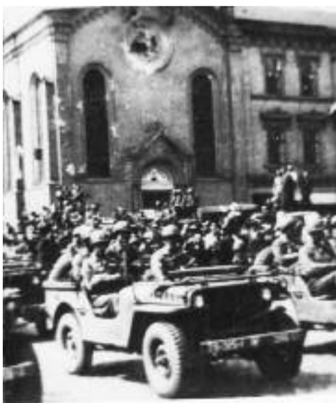
Osvobození města Plzeň - v pozadí kostel, jenž naše církev po válce získala