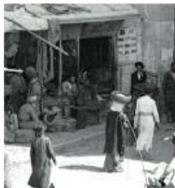
Starý Jeruzalém - prodejna klobouků

žádného stání a řekl jsem „at' se děje vůle Boží“ a šli jsme přece. Měli jsme koupiti škapulíře. Dostali jsme na ně 2 pětifranky a dva zlaté desíťfranky. Pod Táborem viděli jsme plno bud roztroušených a rozházených. Daleko jsme nedošli a s hrůzou jsme poznali, že je zle. Šlo jich proti nám devět, černých jako d'áblů posledních. Všichni roztáhli proti nám ruce a vzkřikli jako zběsilí: „Šavaltess massary“ (dejte peníze) a vrhli se na nás. Nejdřív popadli ranec s proviantem. Ranec se rozlétl a co v něm bylo, za chvíli zmizelo.