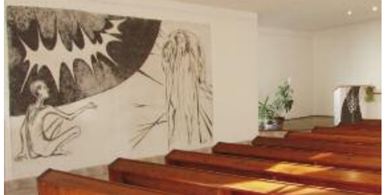
Sbor Kristova kříže v Plzni se sgrafitem Jany Wienerové „Jóbova otázka - Kristova odpověď“

Přeji vám všem, aby váš sbor byl místem odpočinutí poutníků, azylem pro ty nejmenší a zraněné, útočištěm před nemilosrdným světem, ve kterém žijeme. V milosti svatého Kristova kříže dnes přijměte tedy požehnání pro dny další.