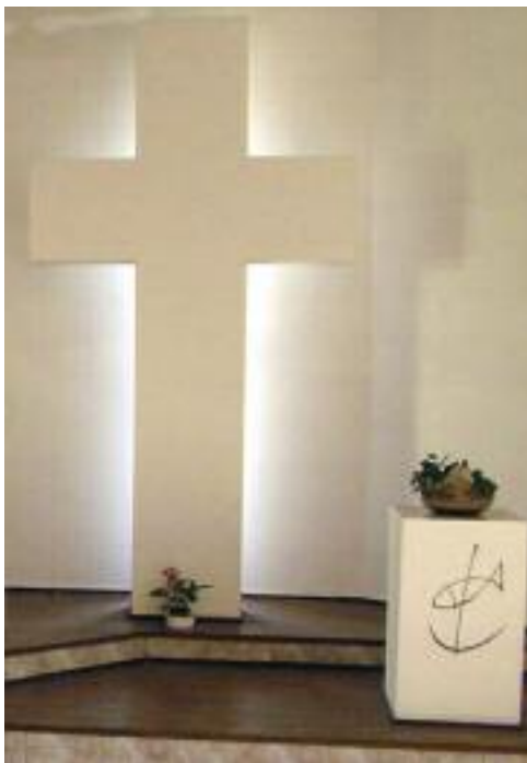
Ptzeňský sbor Kristova kříže

Věříme, že Ježíš Kristus svým dílem zlomil osten smrti i pro nás a díky účasti na Boží spáse v Kristu patříme i my Bohu v životě i ve smrti. Nikdo a nic v celém tvorstvu nemůže nás odloučit od lásky Boží, která je v Kristu Ježíši, našem Pánu (Ř 8,38-39). To je základní jistota podle Písem (1 K 15,3-4).