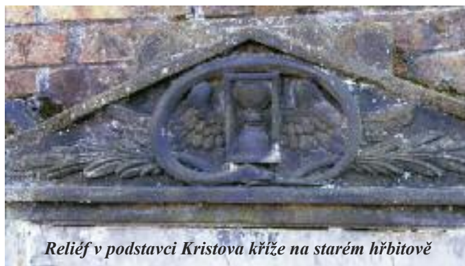
Reliéf v podstavci Kristova kříže na starém hřbitově

ve 4. století, kdy byli připomínáni ti, kteří trpěli pro křesťanskou víru a ztratili svůj život v době pronásledování. Vilém Auer v knize Obrázkový život svatých pro školu a dům uvádí, že papež Řehoř III. dal r. 731 v Římě v chrámu sv. Petra zřídit kapli ke cti a chvále „apoštolů, mučedníků a spravedlivých“ a nařídil, aby na ně věřící na konci církevního roku vzpomínali. Pů-