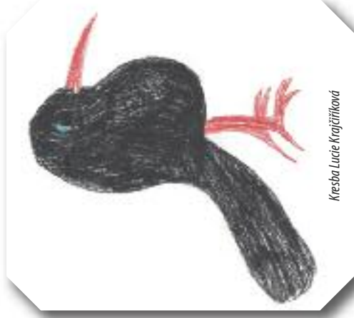
Kresba Lucie Krajčříkové