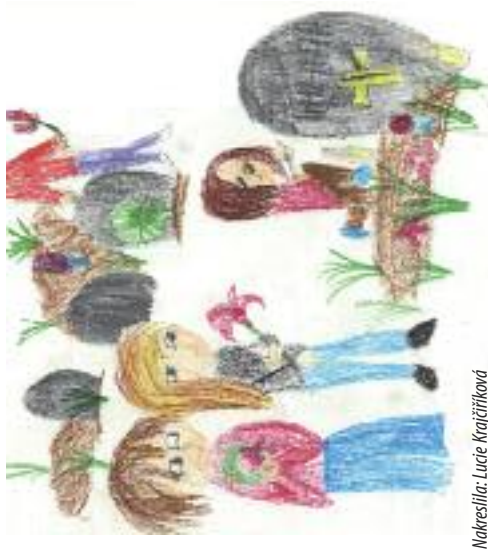
Nakreslila: Lucie Krajčířiková