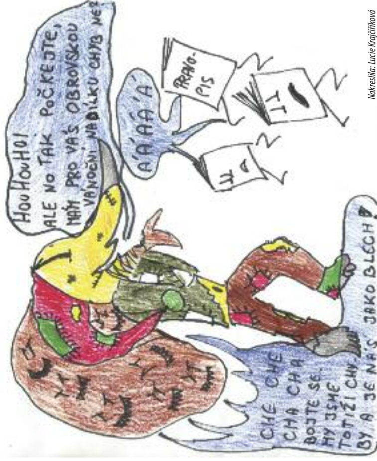
Nakreslila: Lucie Krajčříková

Alenka si prohlédla kapsy a našla několik bombonů, kterými je odměnila za ten bláznivý závod. Všichni čtyři kamarádi zapomněli na holičku a zaměřily se na potěšení ze slatkosti. A tak Alenka odeslala. Jak tak kráčela, uviděla modrou housenku, která seděla na houbě a kouřila. Když jí Alenka vyprávěla, že si přeje vyrůst, housenku to urazilo (ona sama měřila jen sedm centimetrů), ale rozhodla se Alence pomoci. Dala jí kousíček ze své kouzelné houby, aby vyrůstla. Díky pár kousnutím Alenka dosáhla stejné velikosti jako králík.