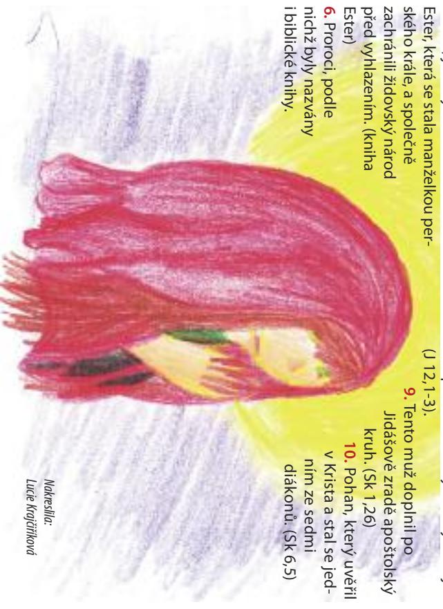
Nakreslila: Lucie Kotčířková