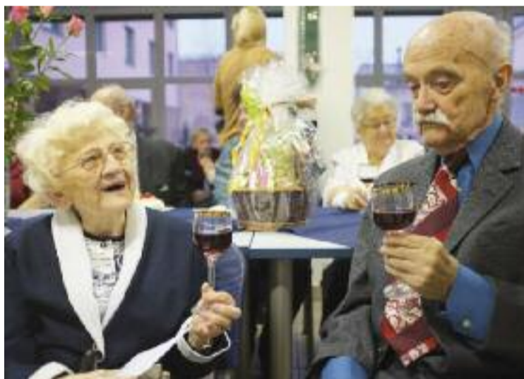
Ze života Domova důstojného stáří: oslava jubilantů

Když se v Brně-Maloměřicích začínalo s přípravnými základovými pracemi na plánovaný dům pro seniory, šířila se sice v okolních ulicích šeptanda: „Kdepak, to nebude pro našince, ale pro nějaké prominenty. Prý to má být pro Němce.“ Ovšem v současné době jsou takové průpovědky už jen k pouštění. Zdá se, že by vztahy s okolím snad ani nemohly být lepší. Zejména proto, že vedení radnice městské části, na jejíž zadní trakt shodou okolností náš dům s parčíkem navazuje, mělo pro tento projekt od prvního setkání maximální porozumění. Po vstřícném starostovi, který se stal přímo jakýmsi spoluzakladatelem, převza-