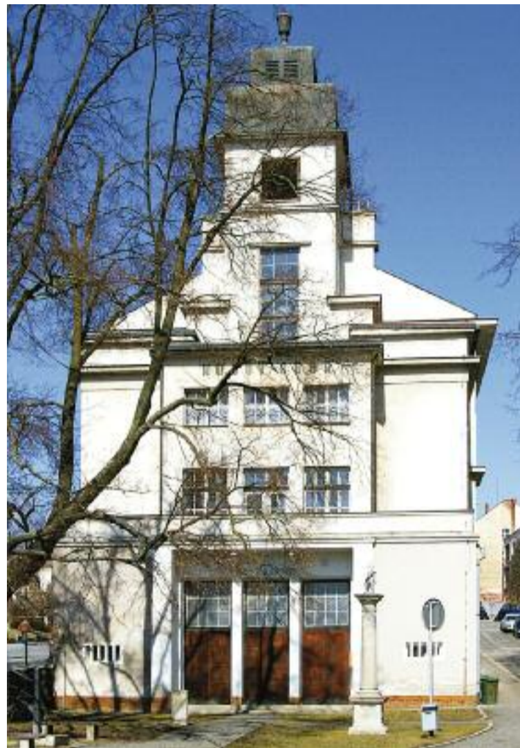
Sbor v Havlíčkově Brodě