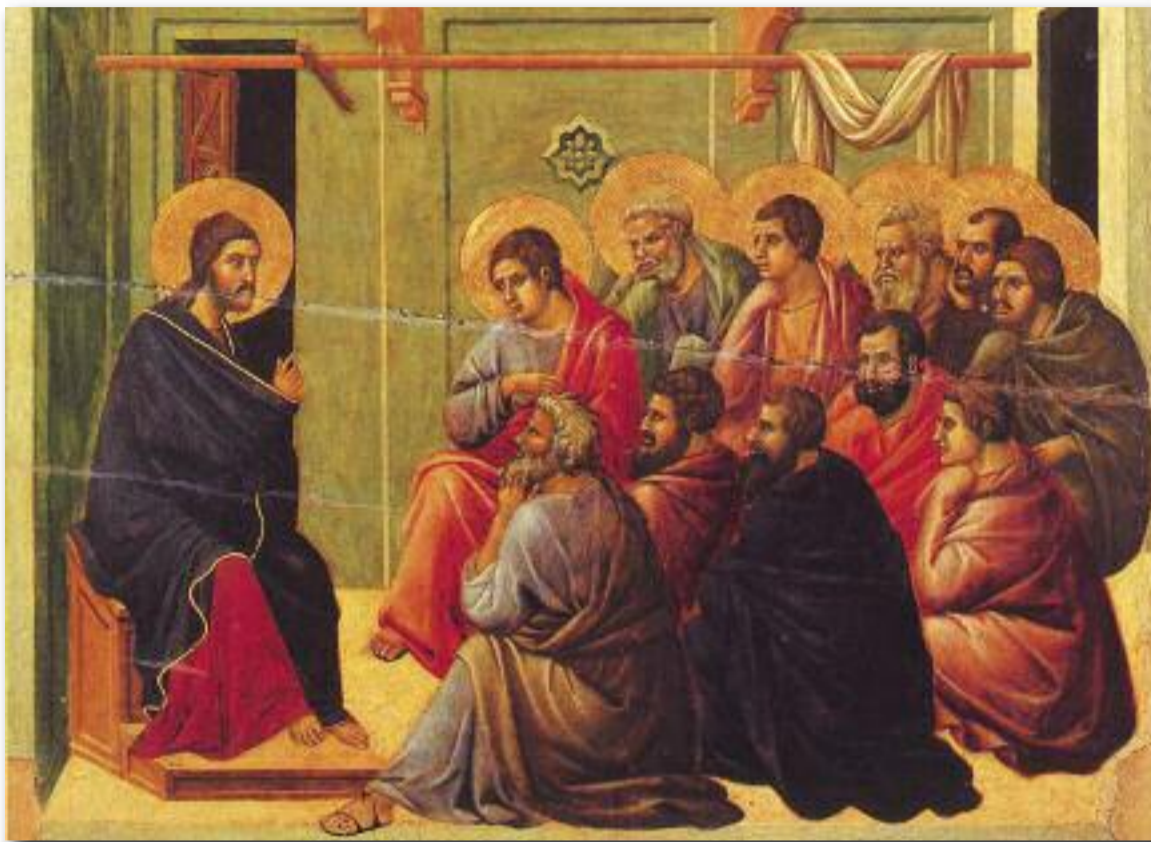
Kristus s apoštolý na obraze italského malíře Duccia z let 1308 – 1311. Tempera na dřevě.