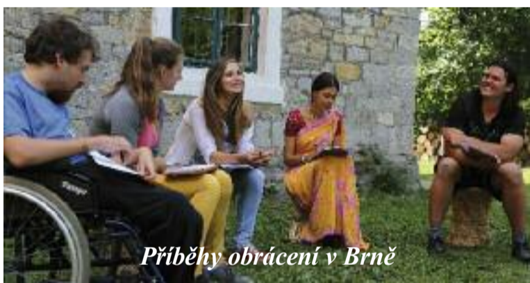
Príběhy obrácení v Brně

Dne 23. května zveme do brněnského sboru naší církve, který je první funkcionalistickou stavbou v ČR z r. 1929. • 19 h - Komponovaný pořad varhanní hudby, filmového obrazu a mluveného slova O obětech násilí a zneužívání – v horizontu uplynulých 70 let. V průběhu večera bude ve sboru ke shlédnutí výstava: Historie kalicha. 600 let od znovuzavedení přijímání z kalicha v české reformaci. red