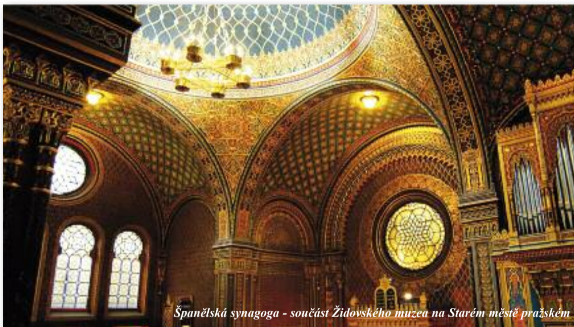
Španělská synagoga - součást Židovského muzea na Starém městě pražském