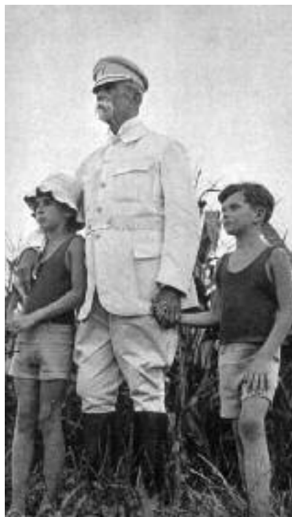
Masaryk s dětmi

Láska k bližnímu je v plánu světa, lidská společnost stojí na lásce; ale nestačí mít k spolučlověku jen tak zvaný milý cit – láska, humanita se musí ztělesnit v práci, v součinnosti, v tvoření, a tím i v zdokonalování světa nám daného. Jsme dělníci