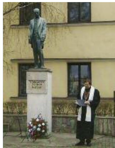
Bratr patriarcha v Čejkovících r. 2010