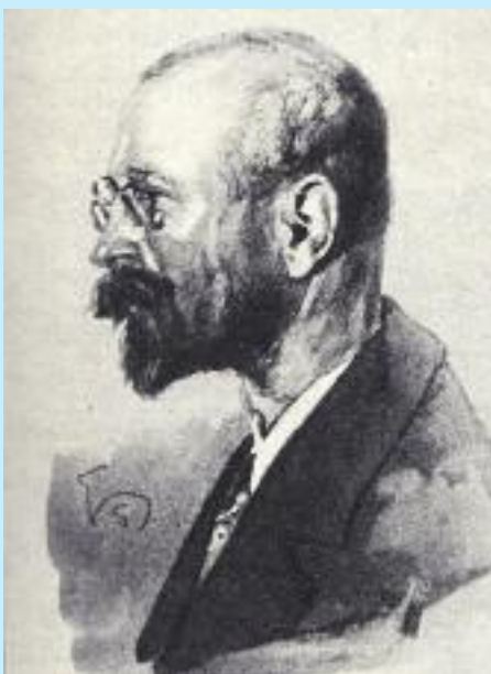
Portrét T. G. Masaryka z doby vídeňské.

Zdroj: časopis Ozvěny domova i světa , č. 37, 1937