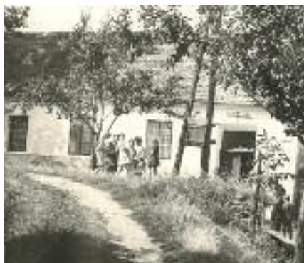
Původní budova muzea v Čejkovících