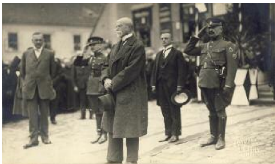
Prezident Masaryk ve Slavkově