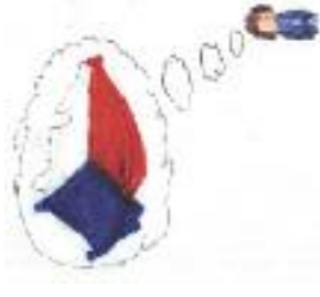
Nakreslila: Lucie Krajčířková

Pane Bože, prosíme tě, pomáhej nám, abychom byli dobrými Čechy, kteří mají rádi svou vlast a svůj národ, ale zároveň si umí vážit i národů jiných. Prosíme tě, ochraňuj naši zem a veď politiky, kteří ji řídí, aby ji spravovali rádně a v souladu s tvou vůlí. Amen.