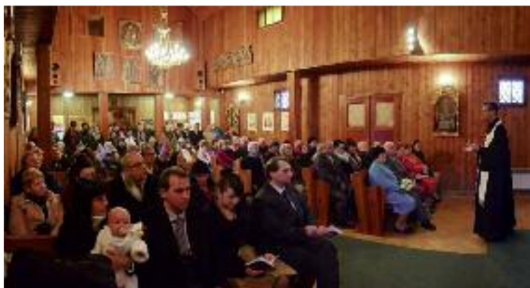
Martin Jindra Dokončení přístě