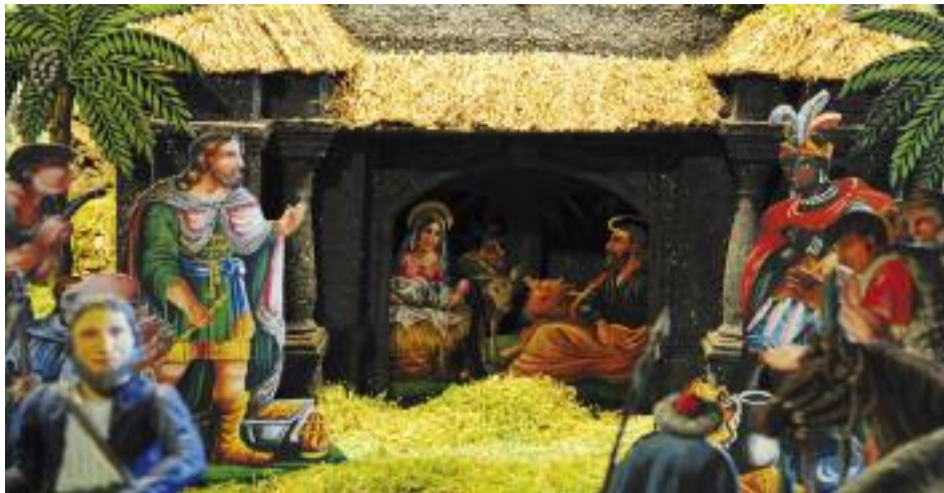
Mechanický betlém ve Frýdlantě v Čechách má rozměry 4x2 metry a obsahuje 130 pohyblivých a 50 statických figurek. Autorem je Gustav Simon, který na něm pracoval 60 let. Mech mezi postavami autor pravidelně obměňoval.