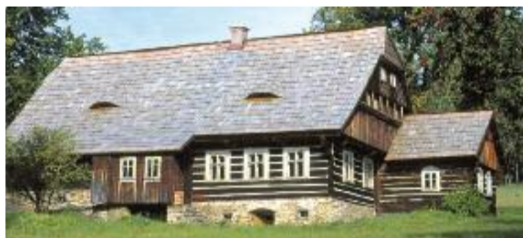
Stará škola v Pasekách n. Jizerou

Jen pár kilometrů od Škodějova, rodiště zakladatele naší církve dr. Karla Farského, a od krásného sboru ve Vysokém nad Jizerou žil a působil v devatenáctém století Věnceslav Metelka. Zápisníky tohoto podkrkonošského učitele, všestranného muzikanta, zakladatele slavné houslařské školy a divadelního ochotníka posloužily jako inspirace K. V. Raisovi k románu „Zapadlí vlastenci“. Uvádíme Metelkovy poznámky ze Silvestra 1842 a v jejich intencích přejeme Vám, čtenářům i Vaším blízkým nadějeplný rok 2014 a v něm Kristův Pokoj.