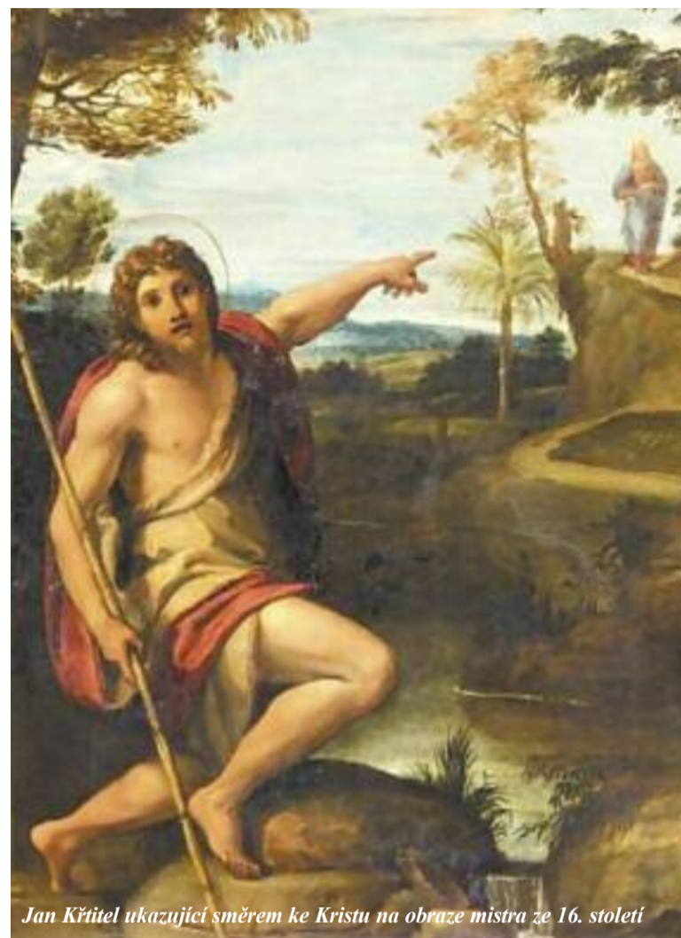
Jan Křtitel ukazující směrem ke Kristu na obraze mistra ze 16. století