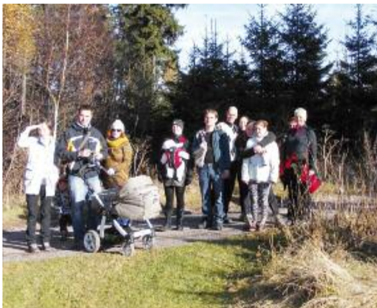
Setkání se účastníci i nejmenší členové - fotka z výletu na Zlatou vyhlídku

Máme všichni stejný přístup ke vzdělání? Jak pomoci těm, kteří mají touhu se vzdělávat, ale jejich sociální či zdravotní hendikep se stává brzdou na cestě k vysněnému cíli? Je v našich silách, silách obyčejných studentů, odstranit některé bariéry a poskytnout konkrétní pomoc?