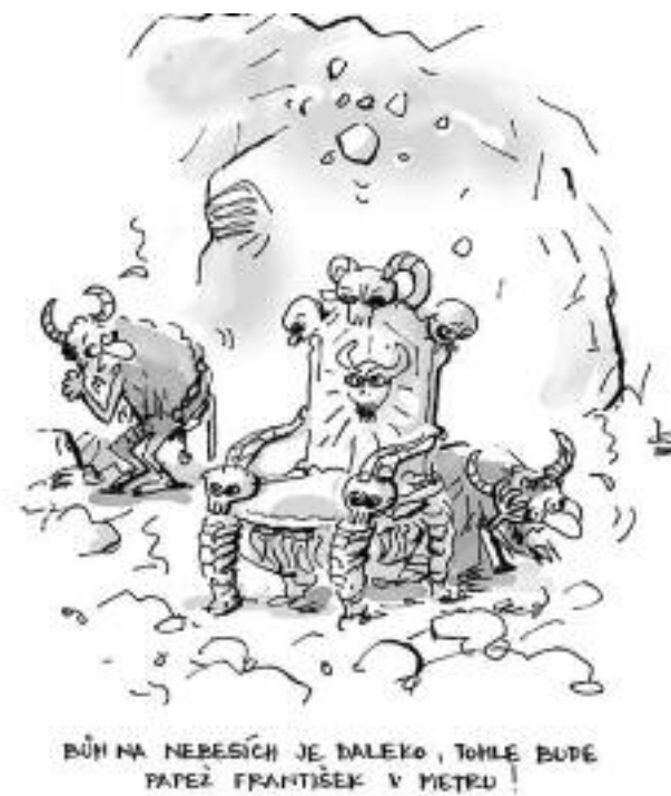
Kresba: Miroslav Kemel (s laskavým svolením autora, www.KEMEL.cz; publikováno v MfD)