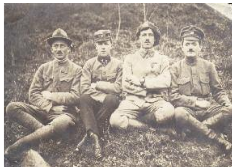
Českoslovenští legionáři (Itálie, Francie, Rusko), foto: rodinný archiv