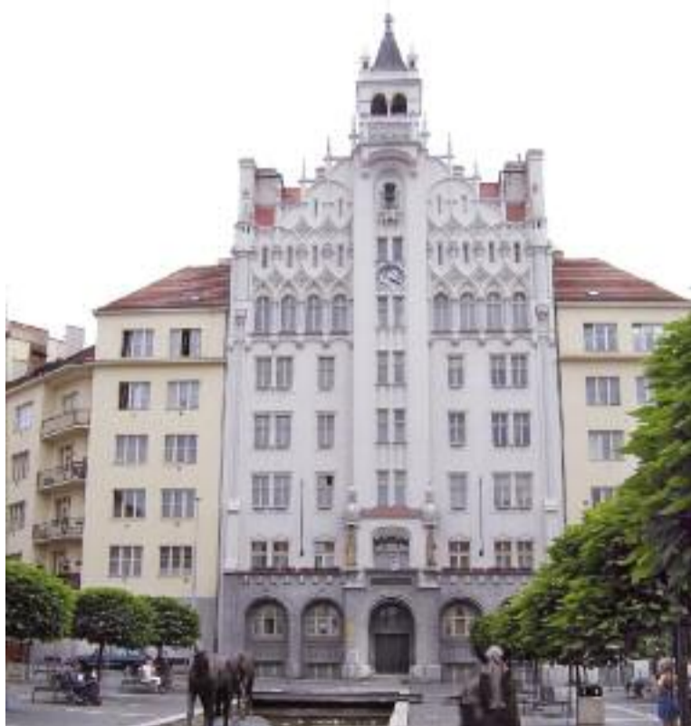
Budova ústředí Církve československé husitské a Husův sbor v Praze 6-Dejvicích byly jako obvykle místem konání volebního sněmu.