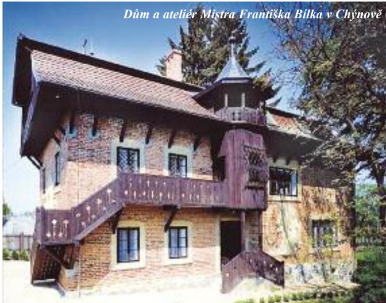
Dům a ateliér Mistra Františka Bilka v Chýnově