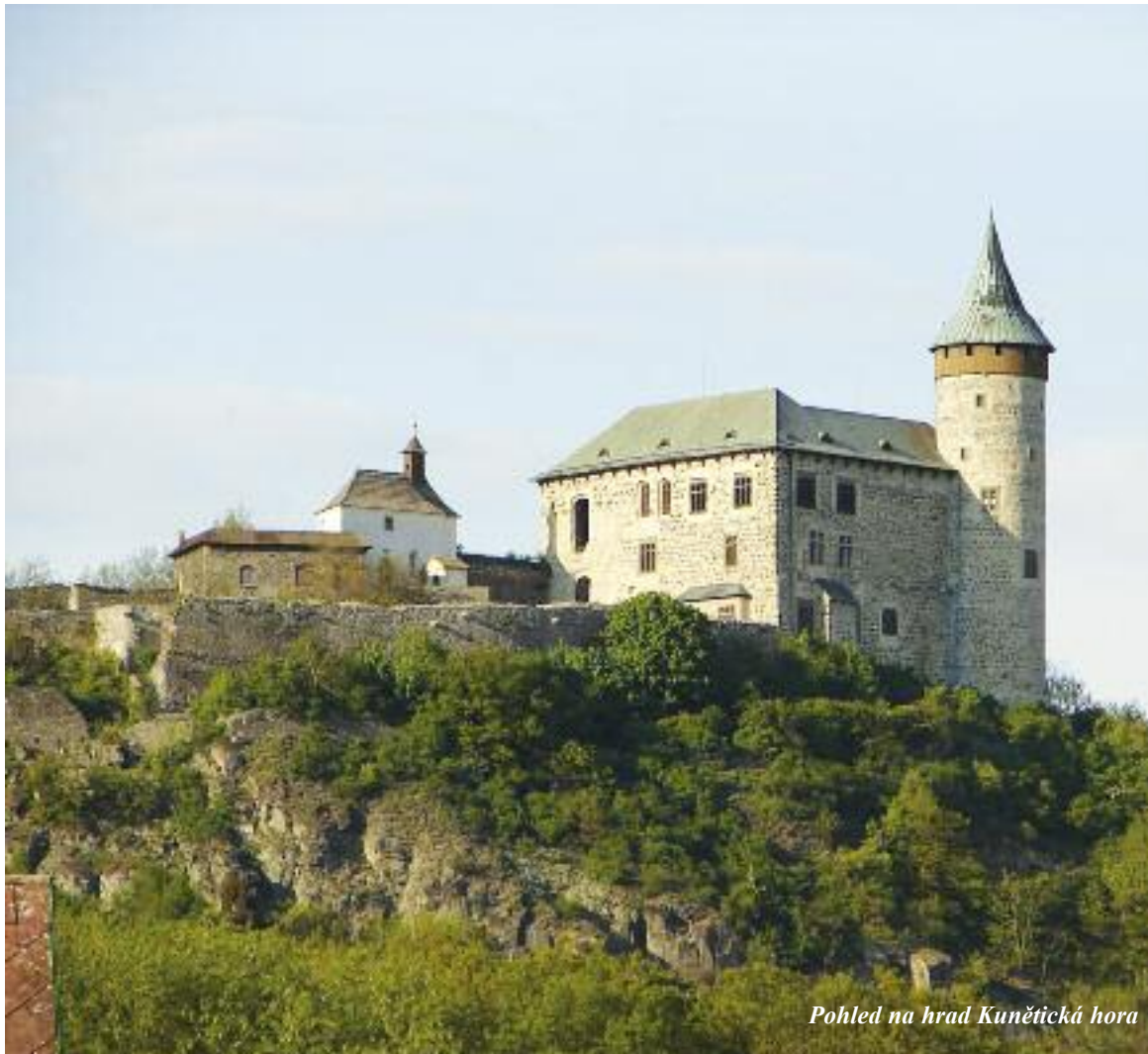
Pohled na hrad Kunětická hora