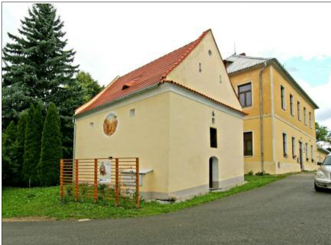
Památník a muzeum Petra Chelčického v Chelčicích

Tím druhým společným rysem byla myšlenka rovnosti a zpochybnění hierarchického uspořádání a postavení ve společnosti. Petr Chelčický psal o rovnosti v křesťanském společenství v návaznosti na biblické zásady a po příkladu prvotní církve. V Sítí víry uvádí základní principy jednání takového společenství založeného na osobních vztazích: „...aby rovnosti Dokončení na str. 3