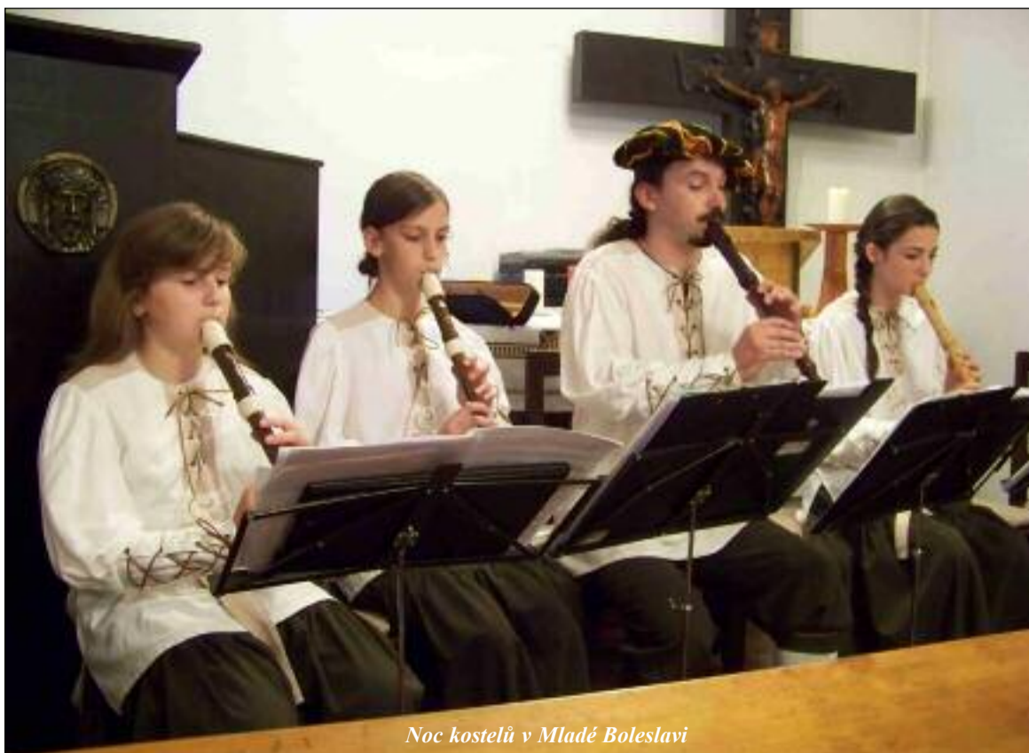
Noc kostelů v Mladé Boleslavi