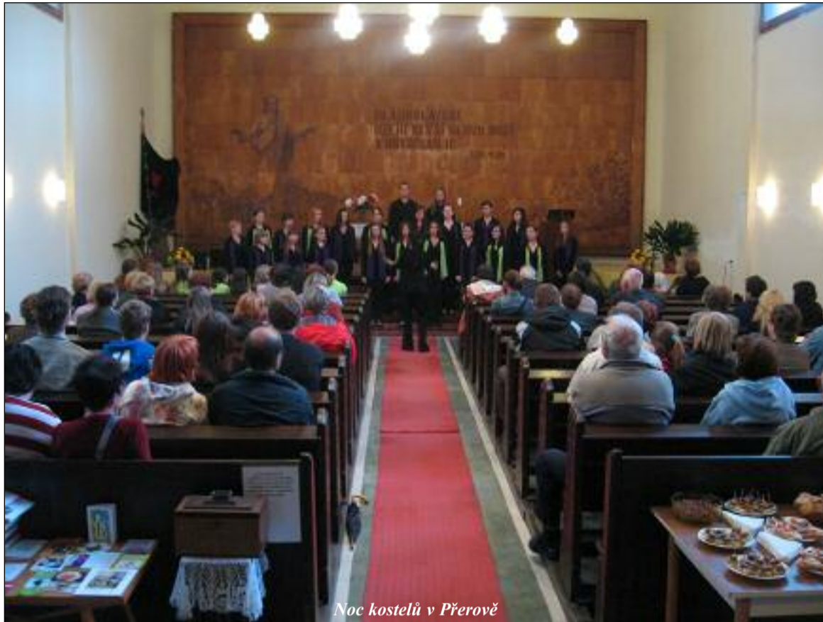
Noc kostelů v Přerově