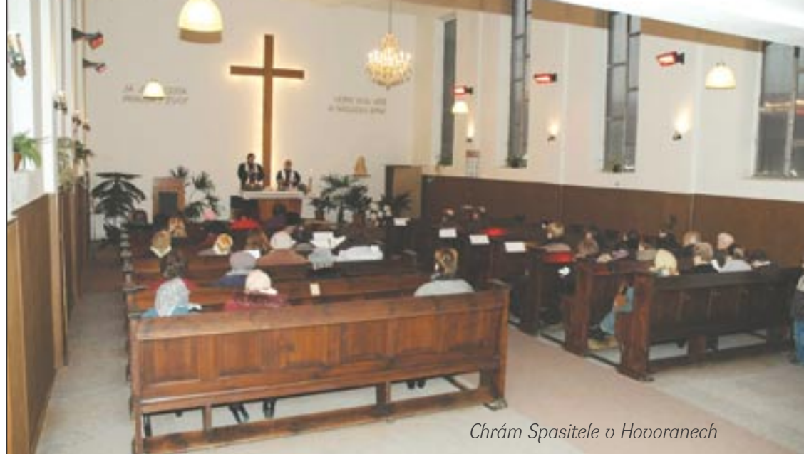
Chrám Spasitele v Hovoranech

Naše sbory až na výjimky jsou většinou jednoduché a prosté. Středem celého prostoru je stůl Páně . Je tomu tak proto, že Ježíš se svými učedníky slavil hostinu u stolu. Církev se po staletí i dnes setkává kolem Ježíšova stolu. Nad stolem nebo na jiném viditelném místě se nachází kříž . Toto znamení je spojené s koncem Ježíšova životního příběhu, s jeho utrpením a smrtí. Tím však jeho příběh neskončil. Na stole bývá položena velká kniha. Touto knihou je Bible , ze které se čtou příběhy z dávných dob o izraelském národě a zvláště dochované vyprávění o Ježíšovi a o první církvi. V kostele bývá vyvýšený dřevěný pultík, který se nazývá kazatelna . Bratr farář nebo sestra farářka z tohoto místa promlouvá ke shromážděným lidem. Kázání není jen kárání, napomínání, ale kazatel vykládá z Bible, co všechno pro nás Bůh učinil a činí. Jaká je dobrá cesta, na kterou nás Ježíš zve a po níž nás chce vést. Na zdech bývají nápisy , které jsou citáty a výroky z Bible, aby to důležité měli