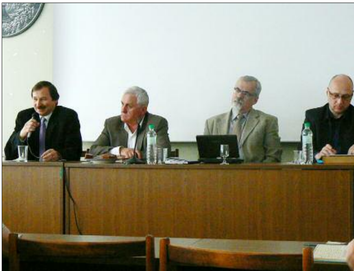
Ze studijního dne Ekumenické rady církví