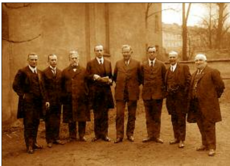
Fotografie zakladatelů církve