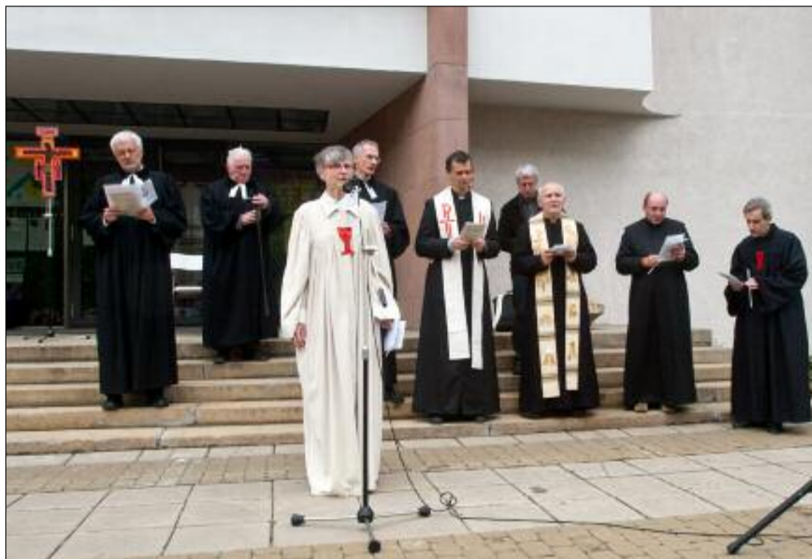
Z brněnské bohoslužby proti násilí