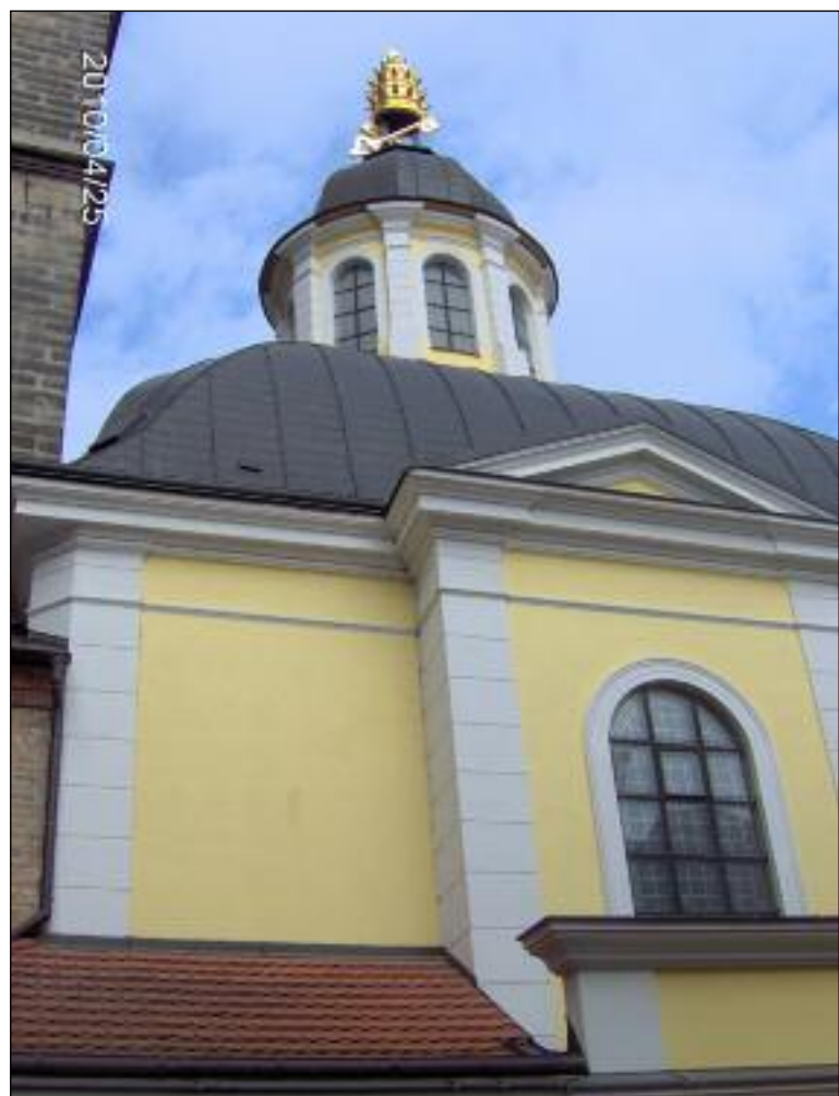
Kaple sv. Klimenta v Hradci Králové