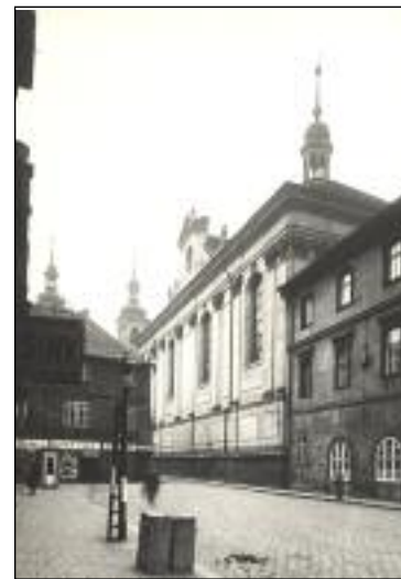
Kostel v Klementinu

Uvážíme-li, že od založení prvních kostelů v Čechách uplynulo dodnes jedenáct století a že od té doby dodneška byl každý kostel přestavován několikrát, a přihlédneme-li k případ-