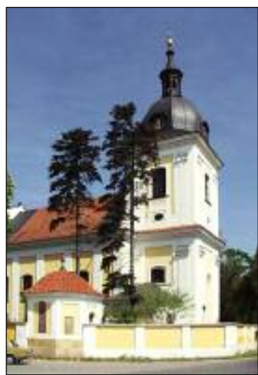
Kostel v Dobřenicích

Z mapky je rovněž možno vyčíst, kdy Metodějovi žáci do Čech přišli. Jejich první zastávka byla již v Lito-myšli, městě na moravsko-českém pomezí. Tam založili kostel sv. Klimenta. Ten se do dnešní doby nezachoval, ale jeho tehdejší existence je spolehlivě doložena (viz Použité prameny č. 2, str. 13). Druhou zastávku vykonali v Hradci (nynější Hradec Králové), kde jejich misijní činnost dokládá kaple sv. Klimenta, přestavěná v barokním slohu a krásně zrenovovaná (viz Použité prameny č. 3, str. 5). Další zastávkou misionářů byla obec Dobřenice, kde stojí kostel sv. Klimenta, taktéž přestavěný v barokním slohu (viz Použité prameny č. 2, str. 10).